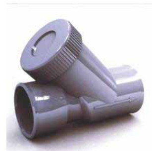
Bouche de nettoyage : pour le nettoyage du clapet antiretour.